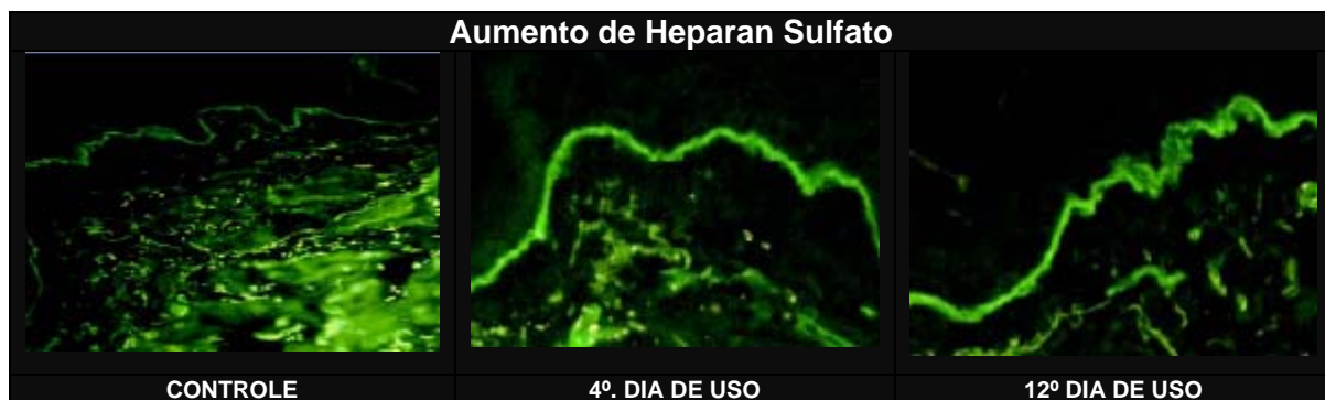
Figura 4: Fonte: Lit. Original PADINACTIVE® SKIN

As figuras 2, 3 e 4 representam os testes realizados por imunofluorescência (teste qualitativo que mostra através da quantidade de luz absorvida, a presença da substância investigada). Uma formulação contendo 5% de PADINACTIVE® SKIN foi aplicada e conforme protocolo, biopsias de pele foram realizadas. Comparado com as biópsias controle é possível observar já no quarto dia de uso, que há um aumento importante de todos os GAGs investigados. Destaque para o Ácido Hialurônico (GAG mais abundante) e para o Heparan Sulfato que concentra-se na camada basal da epiderme. Estudos mostram que a carência desta glicosaminoglicana influencia diretamente no ritmo de renovação celular.