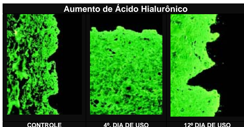
Figura 2: Fonte: Lit. Original PADINACTIVE® SKIN

A figura 1 mostra a avaliação das peles controle e tratada com PADINACTIVE® SKIN a 5%. Note que a partir do quarto dia, ocorre uma diferença significativa na espessura da epiderme e da derme, com abundante deposição de GAG's na derme. Como a nutrição da epiderme é feita pela derme através das papilas dérmicas, o preenchimento também é perceptível na epiderme. Este conjunto de ações proporciona uma pele com menor quantidade de rugas e um relevo mais uniforme.